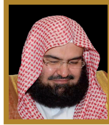
أستاذ الكرسي أ.د. عبد الرحمن بن عبدالعزيز السديس الرئيس العام لشؤون المسجد الحرام وشؤون المسجد النبوي إمام وخطيب المسجد الحرام