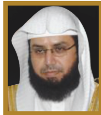
د. خالد بن علي الغامدي قسم القراءات بجامعة أم القرى إمام المسجد الحرام