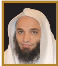
د . فيصل بن جميل غزاوي وكيل كلية الدعوة للدراسات العليا بجامعة أم القرى - إمام المسجد الحرام