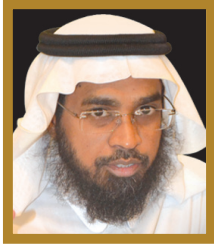
المشرف على الكرسي أ.د. يحيى بن محمد زمزمي أستاذ القرآن وعلومه بجامعة أم القرى